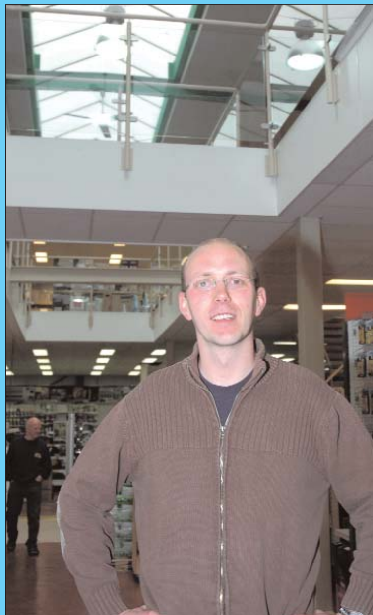
"Voor mij is deze winkel een leuke speeltuin, anders zou ik het nooit volhouden"

"Vervolgens heb ik de totale winkelvloer per productgroep opgedeeld in duidelijk afgebakende mini-shops in U-vorm: hoge rekken aan de zijkanten en lage rekken aan de binnenkant. Elke rubriek heeft een eigen kleur en wordt aangeduid met de goed zichtbare bewegwijzering. Onze winkel moet een zekere uniformiteit uitstralen. Om die reden kreeg ook de buitengevel een grondige facelift. Vanaf het moment dat de klant onze oprit oprijdt, moet hij de sfeer van de winkel voelen. De winkelverlichting speelt eveneens een belangrijke rol in het nieuwe concept. Enerzijds is er voldoende lichtinval via de dakkoepels, anderzijds hebben we zwaar geïnvesteerd in de juiste lampen. Het licht in de verfafdeling is anders dan in de rest van de winkel. In een latere fase wil ik zeker nog